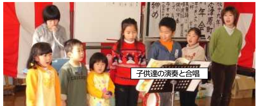
子供達の演奏と合唱