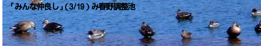
「みんな仲良し」(3/19)み春野調整池

大勢で一人をやつつける事は文句なしに卑怯です。仮にいじめられる子が性格の捻じ曲がった大喧嘩で、いじめの側の子が清く正しく美しくても、です。大勢側に付和雷同し「緒になつて弱い者いじめする奴らだ」といふ事を、卑怯は人間として最も軽蔑される行為だといふ事を、徹底的に教え込むべきだ...と私は思つています。 [原の黙殺] ]