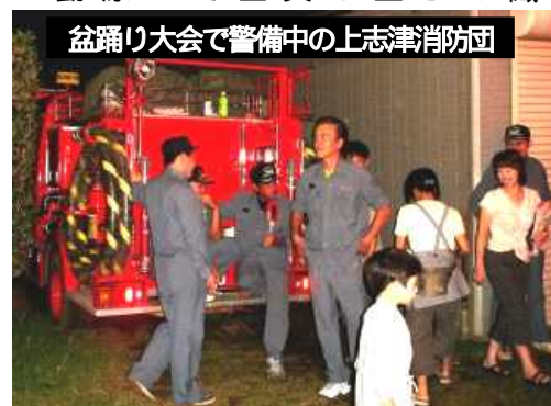
盆踊り大会で警備中の上志津消防団

地域住民で組織され、それぞれの仕事を持ちながら火災や災害が発生すると、消防署と連携し消防・防災活動を各担当地区において従事して頂いております。