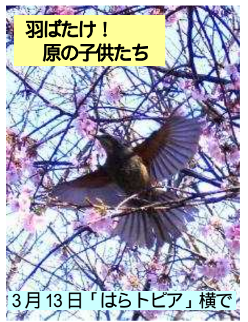
羽ばたけ! 原の子供たち

今年も入学・卒業の季節がやってきました。該当する子供たちにとっては大きな節目で、環境が変わる不安がある一方新しい世界へのステップに胸のときめく時期でもあると思います。 上記の入学・卒業生一覧を見ると、ピカピカの1年生の何と多い事か、何しろ南志津小学校で今年の1年生は、半分以上が「上志津原の子供」だそうですね。上志津原の将来は前途洋々ですね。