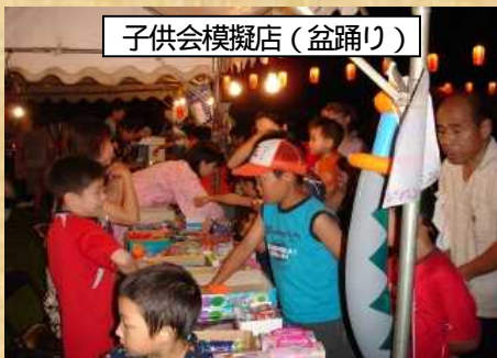
子供会模擬店(盆踊り)