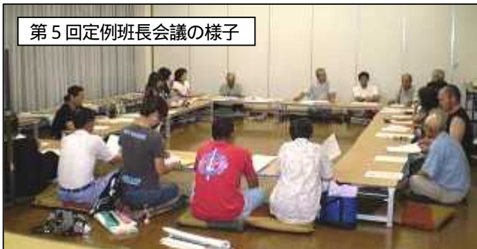
第5回定例班長会議の様子