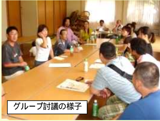
グループ討議の様子

この団地は13棟あり町会に加入した場合、受け入れられる班がありません。そこで独自に班の新設が必要として、班の名称、初代の班長を決めるグループ討議をお願いしました。