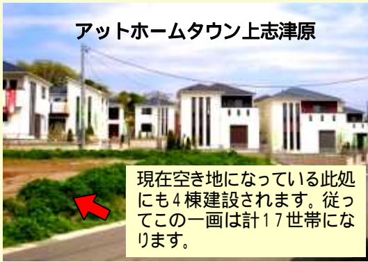
アットホームタウン上志津原 現在空き地になっている此處にも4棟建設されます。従ってこの一画は計17世帯になります。

開催日時：8月19日(日)10時 開催場所：はらトピア 説明内容：町の概要、全い立ちや自治会の仕組み、はらトピア利用の仕方、子供会等の紹介など