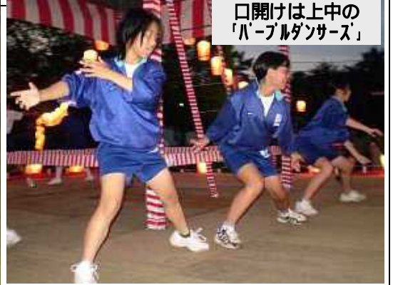
口開けは上中の「パールダンサーズ」