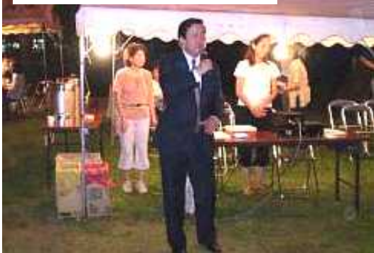
藤佐倉市長も駆けつけました