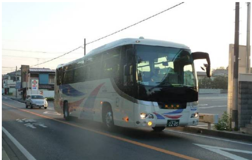
写真：9月1日5時39分、1番バスが上志津原を出発しました。

運行するのは「ちばグリーンバス」と「千葉内陸バス」で、東京駅行きは平日、5時39分、8時39分、16時19分の3本、帰りは東京駅発21時35分の1本で、上志津原着は22時31分です。上志津原―東京間の所要時間は、どの便も1時間以内です。